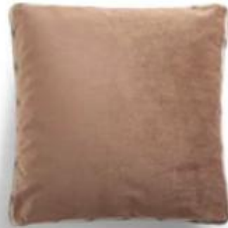
Coussin Charlie Naples