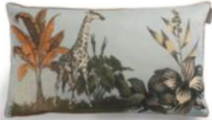
Coussin Bestiaire Melman