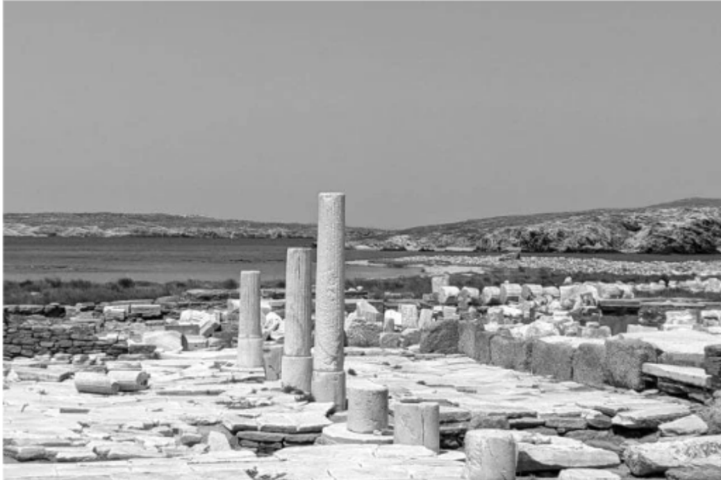
SANCTUAIRE DELOS @BENJAMIN CARTERET

À la Villa Gabrielle, elle souhaite "créer un lieu de rencontre privilégié entre amateurs d'art et talents de demain". Dans l'arrière-cour, la fondatrice explique que le jardin est "à quelques pas du square de l'Oiseau-Lunaire, l'emplacement des anciens ateliers d'artistes du 45 rue Blomet qui virent naître le mouvement surréaliste", reprenant ainsi l'idée de l'espace avec son projet.